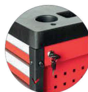
Chiusura laterale di sicurezza con chiave