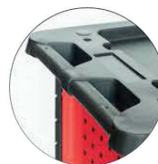
Maniglia resistente incorporata nel TOP