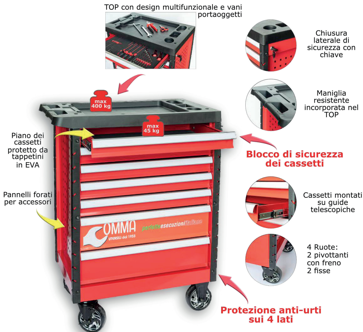
Piano dei cassetti protetto da tappetini in EVA