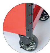
4 Ruote: 2 pivotanti con freno 2 fisse